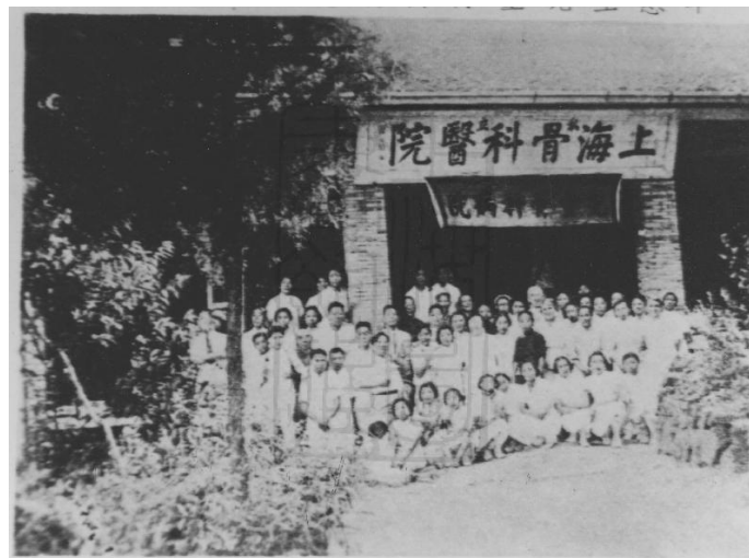
1928 - 上海骨科醫院開業 Opening of Shanghai Orthopedic Hospital

Died -- 4 May, 1937 in Shanghai, Republic of China