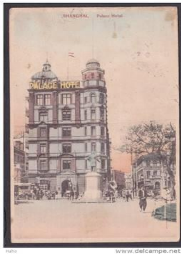
1919 年的汇中饭店 (The Palace Hotel) 照片